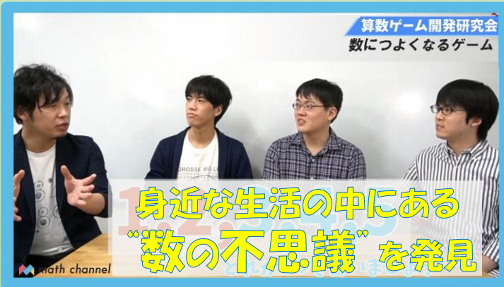
【算数数学】マスチャンネル(理数教育系YouTuber)