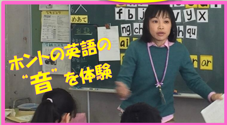
【英語】おともじ(Jフォニックス団体)